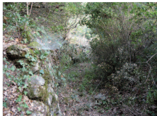
Ανοίχτηκε το μονοπάτι προς το ρέμα. Έτσι φέτος τα μούρα συλλέχθηκαν με λιγότερο κόπο.