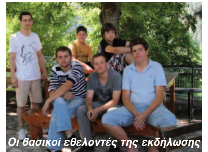
Οι βασικοί εθελοντές της εκδήλωσης

Έτσι λοιπόν, με τη σημερινή μας εκδήλωση που από τριετίας επαναλαμβάνεται κάθε χρόνο αυτές τις