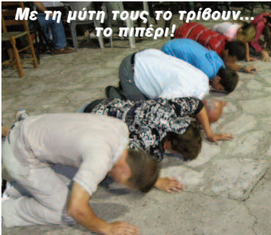
Με τη μύτη τους το τρίβουν... το πιπέρι!