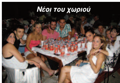
Νέοι του χωριού

επιλογή την Κυριακή 15 Αυγούστου, κατά την οποία όμως υπάρχουν πολλά πανηγύρια στην γύρω περιοχή. Η εκδήλωση είχε αρχικά προγραμματιστεί για τον προαύλιο χώρο του Ι.Ν. Αγίου Αθανασίου στο Δυτικό Παπαρούσι, που είναι μεγάλος και αποδείχτηκε ιδιαίτερα βολικός για τέτοιου είδους διοργανώσεις. Από σεβασμό όμως στο αίτημα οικογενειών του Δυτικού Παπαρουσιού που διατηρούν πένθος, η εκδήλωση τελικά έγινε στο προαύλιο του Ι.Ν. Αγίας Παρασκευής