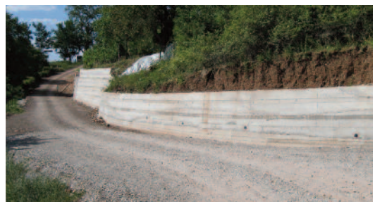
Έγιναν τα τσιμεντένια τοιχία του δρόμου από την θέση Παναγία προς το ρέμα με το πέτρινο γεφύρι. Επιτεύχθηκε έτσι μια άνετη διέλευση δύο αυτοκινήτων στο δρόμο προς το χωριό. Αυτές τις ημέρες διενεργείται διαπλάτυνση στο γεφύρι μετά το Καλεσμενιώτικο μύλο, θα γίνει ασφαλτόστρωση του δρόμου.