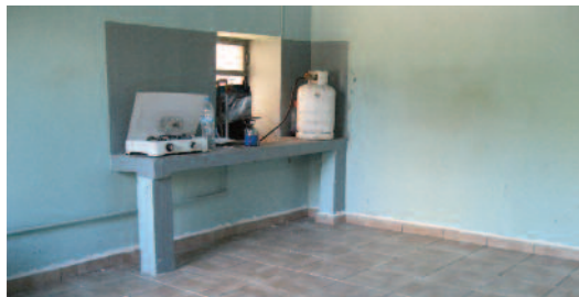
Τα λόγια έγιναν πράξη. Στρώθηκαν πλακάκια στο βοηθητικό μαγειρείο στον περίβολο του Αγίου Αθανασίου.