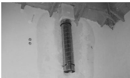
Ο εργολάβος της σκεπής του μελλοντικού Ξενώνα μας επιμελήθηκε του προβλήματος της ύπαρξης υγρασίας στην καμινάδα του τζακιού. Πράγματι κατά τις τελευταίες βροχοπτώσεις δεν παρουσιάστηκε το πρόβλημα πάλι.