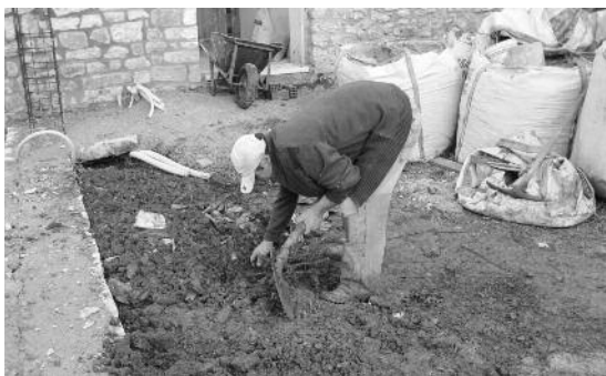
Φυτεύτηκαν τρία δένδρúλλια ελάτης στην είσοδο της αυλής του Ξενώνα.