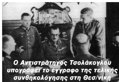
Ο Αντιστράτηγος Τσολάκογλου υπογράφει το έγγραφο της τελικής συνθηκολόγησης στη Θεσ/νίκη

Οι πολεμικές επιχειρήσεις και η νέα κατάσταση που διαμορφωνόταν στην Ευρώπη, θρήκαν την ελληνική οικονομία στηριγμένη στην αγροτική παραγωγή των μικροκαλλιεργητών, στις δεκάδες μεταποιητικές επιχειρήσεις στις οποίες ασχολούνταν κυρίως πρόσφυγες και στην πραγματοποίηση μίας σειράς έργων στους