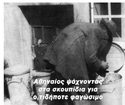
Αθηναίος ψάχνοντας στα σκουπίδια για ο,τιδήποτε φαγώσιμο

κοινωνικά και οικονομικά ένα νέο περιβάλλον, αποκαθιστώντας τους χιλιάδες πρόσφυγες της Μικρασιατικής καταστροφής. Όπως ήταν φυσικό δεν θα μπορούσε να αποφύγει τις συνέπειες μιας τέτοιας κρίσης. Έχοντας ως βασική πηγή εσόδων τις εξαγωγές αγροτικών προϊόντων, η χώρα αντιμετώπισε σημαντικότατο πρόβλημα καθώς η διεθνής οικονομική ύφεση οδήγησε στη δραστική μείωση της ζήτησης ελαιόλαδου, κρασιού, καπνού και σταφίδας, και κατά συνέπεια, στην πτώση της τιμής τους. Πέρα από τα μεγάλα αδιάθετα αποθέματα αγροτικών αγαθών, παρατηρήθηκε και σημαντική αύξηση της ανεργίας στον τομέα μεταποίησης τους που κυμάνθηκε σε ποσοστό 25-32%. Οι επιπτώσεις της κρίσης στην εμπορική ναυτιλία μέσω του περιορισμού του διεθνούς εμπορίου δημιούργησαν προβλήματα και στους Έλληνες πλοιοκτήτες. Πολλά πλοία έδεσαν στα λιμάνια για σημαντικό ποσοστό ναυτικών έμεινε χωρίς δουλειά. Το οριστικό χτύπημα στην ελληνική οικονομία δόθηκε από την αδυναμία δανεισμού από πηγές του εξωτερικού, ενώ τα περιορισμένα αποθέματα χρυσού δεν επέτρεπαν στην Τράπεζα Ελλάδος να πα-