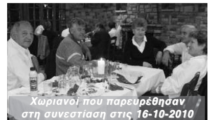
Χωριανοί που παρευρέθησαν στη συνεστιάση στις 16-10-2010