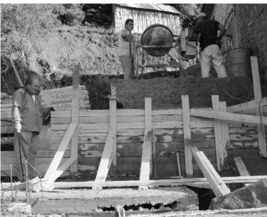
Έγινε αντιστήριξη της νότιας πλευράς του Ξενώνα στο χώρο της κουζίνας και της τουαλέτας.