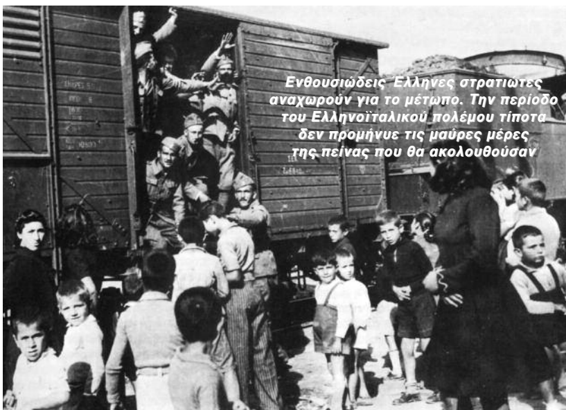
Ενθουσιώδεις Έλληνες στρατιώτες αναχωρούν για το μέτωπο. Την περίοδο του Ελληνοϊταλικού πολέμου τίποτα δεν προμήνυε τις μαύρες μέρες της πείνας που θα ακολουθούσαν

Οι Γερμανοί χώρισαν τη χώρα σε τρεις διοικητικές ζώνες, έχοντας προηγουμένως φροντίσει να εξασφαλίσουν για τους ίδιους τον απόλυτο έλεγχο στους σημαντικότερους τομείς της Ελλάδας. Παρόλα αυτά παραχώρησαν τις εύφορες περιοχές της Ανατολικής Μακεδονίας και της Δυτικής Θράκης στους Βούλγαρους, οι οποίοι επιδόθηκαν σε έναν άγριο διωγμό εναντίον του ελληνικού πληθυσμού και παράλληλα εφαρμόσαν συστηματικά την πολιτική του εποίκισμού. Οι