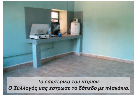
Το εσωτερικό του κτιρίου. Ο Σύλλογός μας έστρωσε το δάπεδο με πλακάκια.