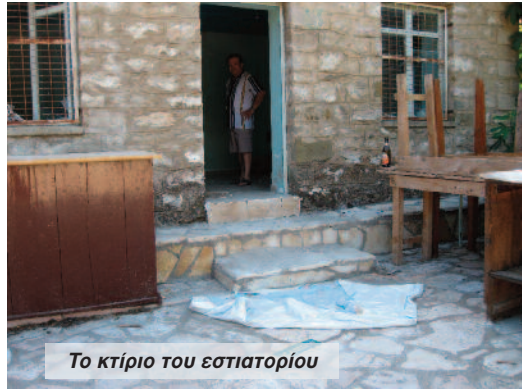
Το κτίριο του εστιατορίου