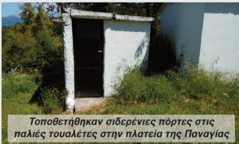
Τοποθετήθηκαν σιδερένιες πόρτες στις παλιές τουαλέτες στην πλατεία της Παναγίας