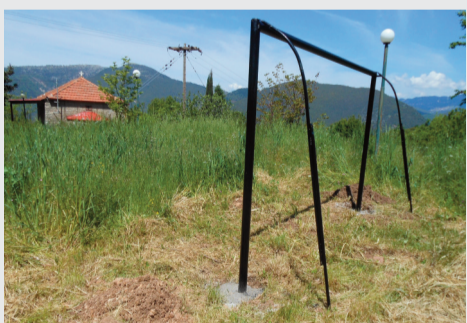
Τοποθετήθηκε ένα μόνο από τα δύο τέρματα που είχε υποσχεθεί προεκλογικά στον μικρό Αργύρη Περίχαρο ο κ. Μπακογιάννης. Κι αυτό μέσα στο χώρο της πλατείας στο Εξωκλήσι της Παναγίας. Δύσκολο πολύ να παίξουν ποδόσφαιρο σε αυτό οι νεαροί το καλοκαίρι.